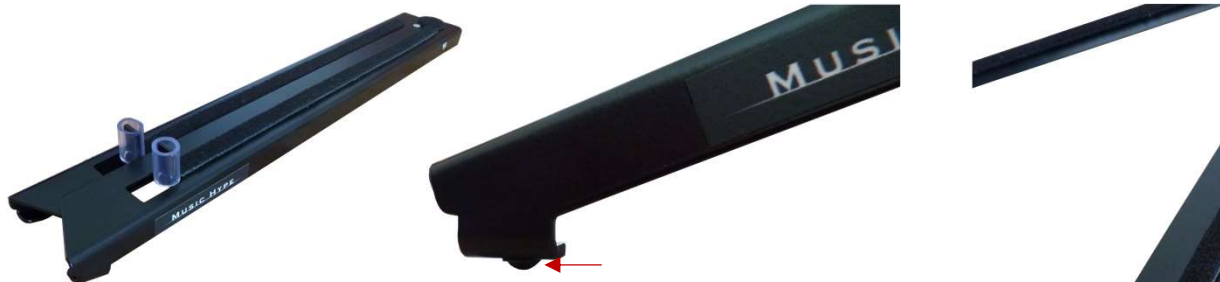
Der zusammengeklappte Hornständer